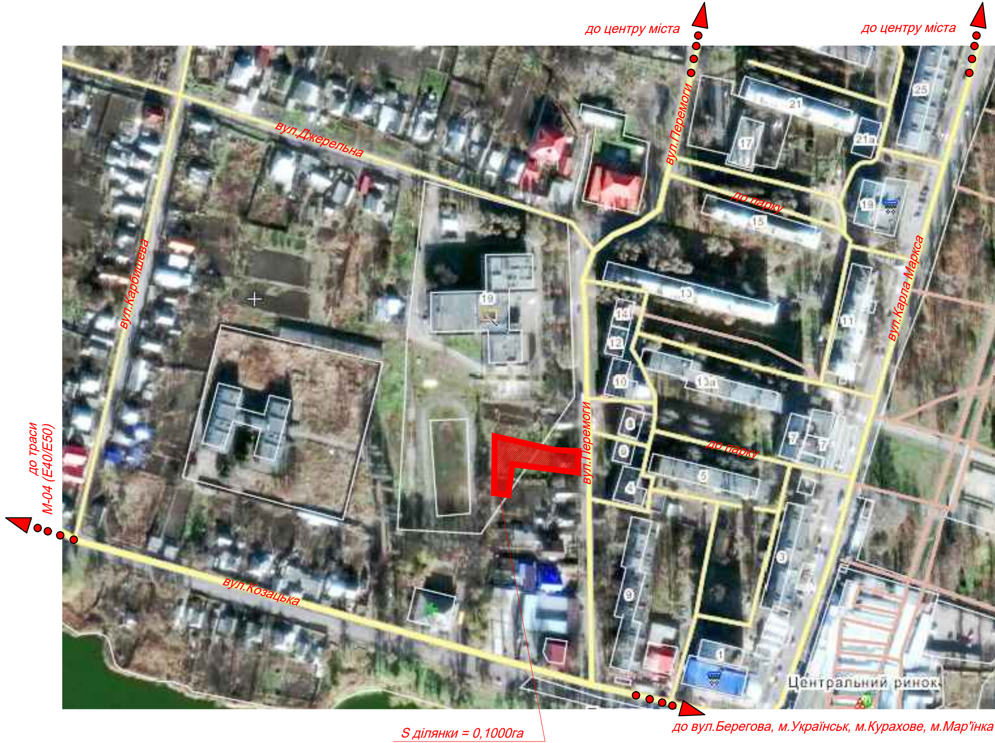
Схема розташування території в планувальній структурі населеного пункту